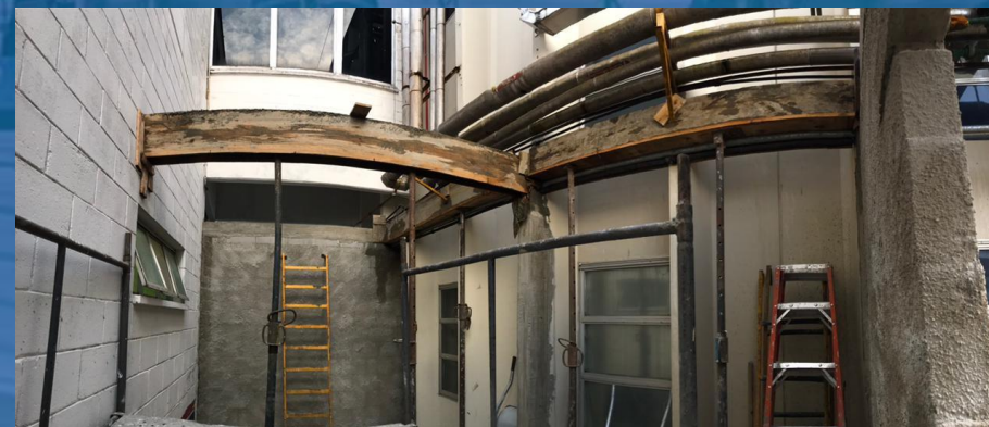
CONSTRUÇÃO DE SALA DE PAINÉIS ELÉTRICOS