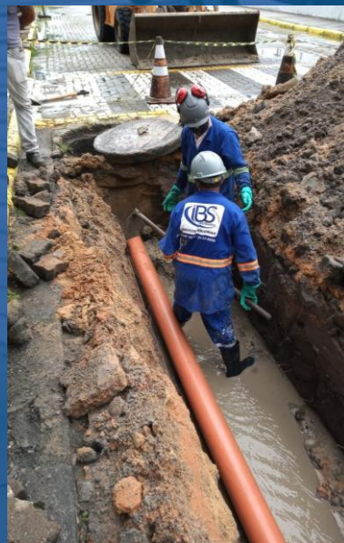
REPARO EM TUBULAÇÃO DE DEJETOS INDUSTRIAIS