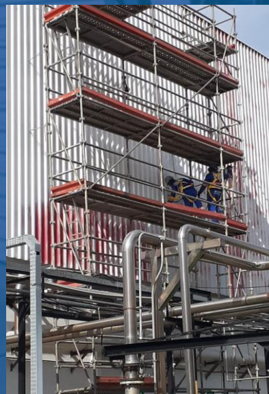
REPARO DE ESTRUTURA