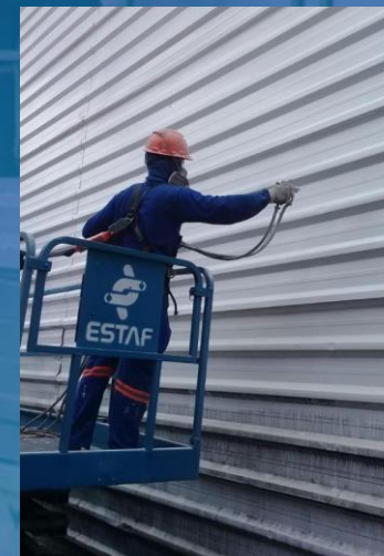
LIMPEZA DE FACHADA