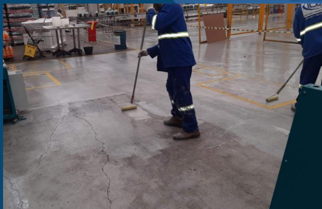
REPARO E RECUPERAÇÃO DE PISO COM AUTONIVELANTE E PINTURA EM EPÓXI