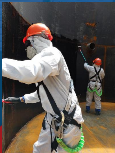
PREPARAÇÃO DE SUPERFÍCIE PARA APLICAÇÃO DE FIBRA + VÉU