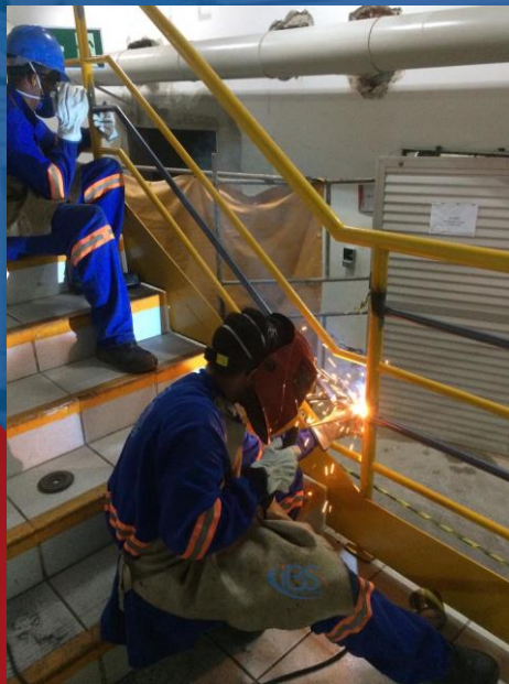
REPARO EM CORRIMÃO