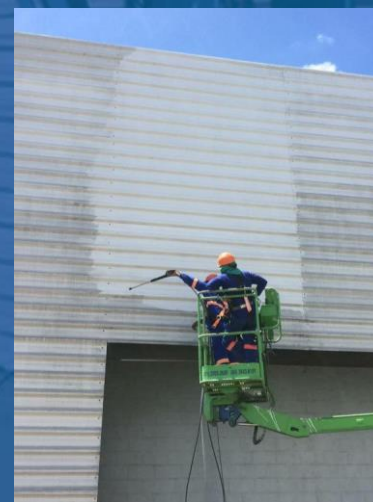
LIMPEZA DE FACHADA