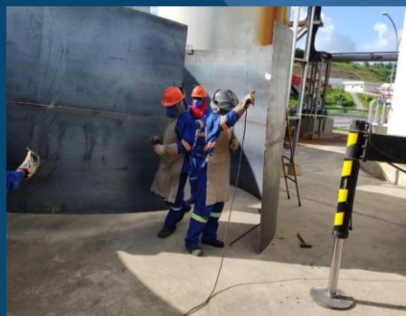
MONTAGEM DE TANQUE