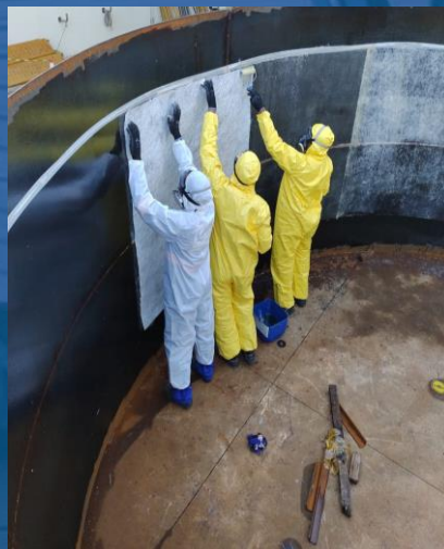
LAMINAÇÃO COM FIBRA DE VIDRO