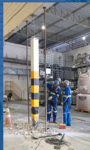
DEMOLIÇÃO CONTROLADA DE PILAR EM CONCRETO ARMADO