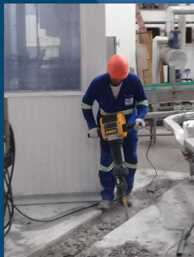
ABERTURA DE VALA PARA INSTALAÇÃO DE TUBULAÇÃO DE DEJETOS INDUSTRIAIS