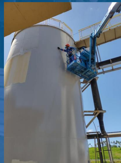
APLICAÇÃO DE REVESTIMENTO EM POLIURETANO(PU)