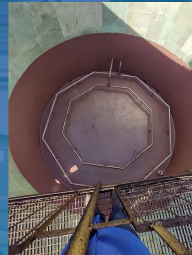
FINALIZAÇÃO DE REPARO EM TANQUE