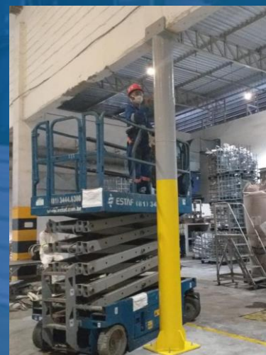
INSTALAÇÃO DE PILAR METÁLICO EM SUBSTITUIÇÃO A CONCRETO ARMADO