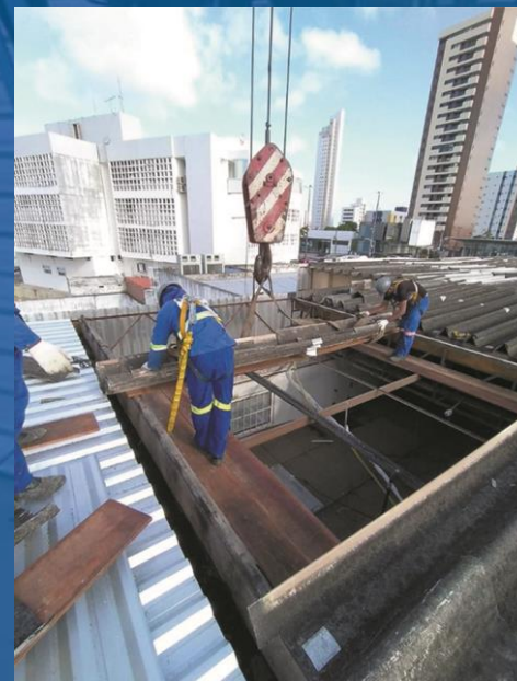
REPARO EM ESTRUTURA METÁLICA