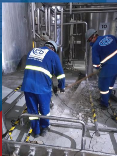
ABERTURA DE VALA PARA INSTALAÇÃO DE TUBULAÇÃO DE DEJETOS INDUSTRIAIS