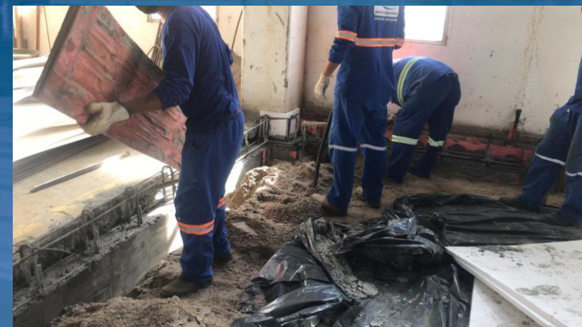
DESFORMA DO CONCRETO DO LASTRO LATERAL DA BASE DE CONCRETO ARMADO PARA ESTUFA