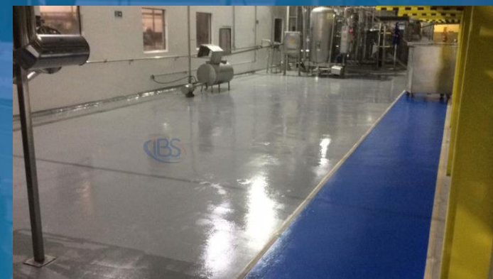
PINTURA DE PISO EM EPÓXI