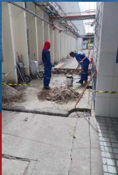
CONSTRUÇÃO DE SALA DE PAINÉIS ELÉTRICOS