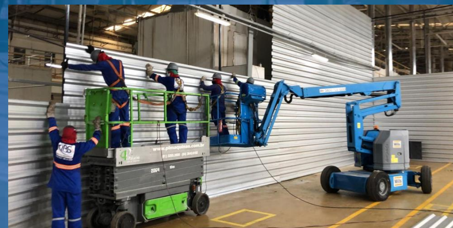
INSTALAÇÃO DE TAPUME TEMPORÁRIO COM PEÇAS METÁLICAS