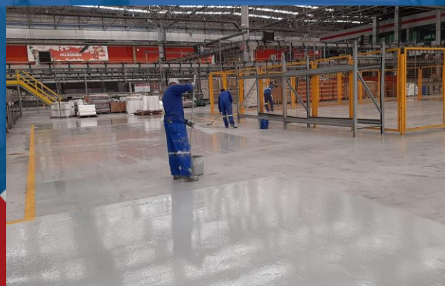
REPARO E RECUPERAÇÃO DE PISO COM AUTONIVELANTE E PINTURA EM EPÓXI