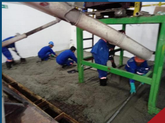
BASE EM CONCRETO ARMADO