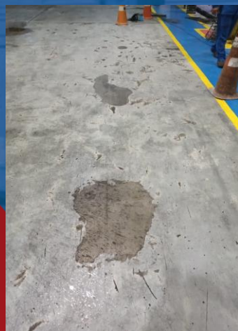
RECUPERAÇÃO DE PISO, COM AUTONIVELANTE