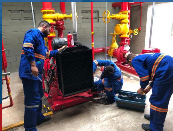
MANUTENÇÃO DE GERADOR