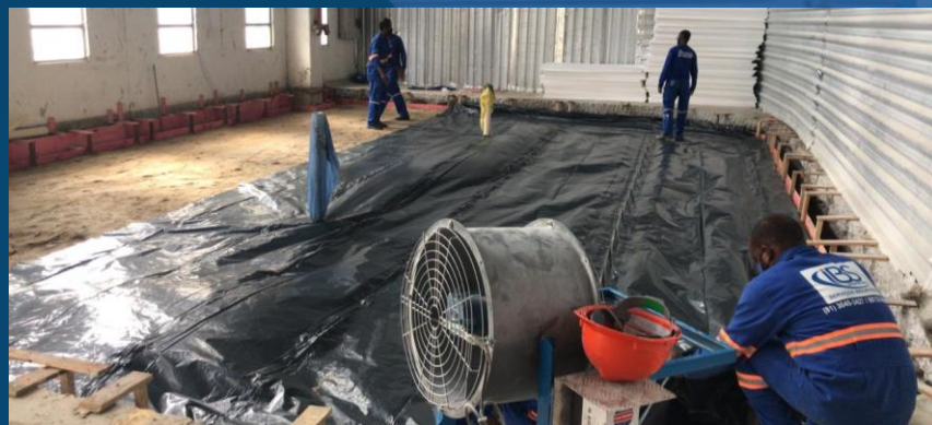
CONCRETAGEM DE LASTRO LATERAL – BASE DE CONCRETO ARMADO PARA ESTUFA