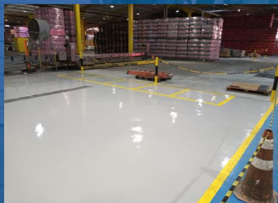
PINTURA DE PISO EM EPÓXI