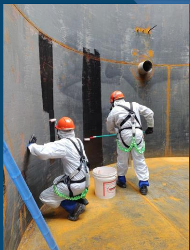
PREPARAÇÃO DE SUPERFÍCIE COM APLICAÇÃO DE PRIMER