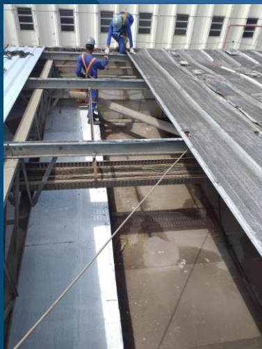
REFORMA E REPARO EM TELHADO METÁLICO