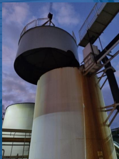
MONTAGEM DE ANEL DO TANQUE DE EQUALIZAÇÃO