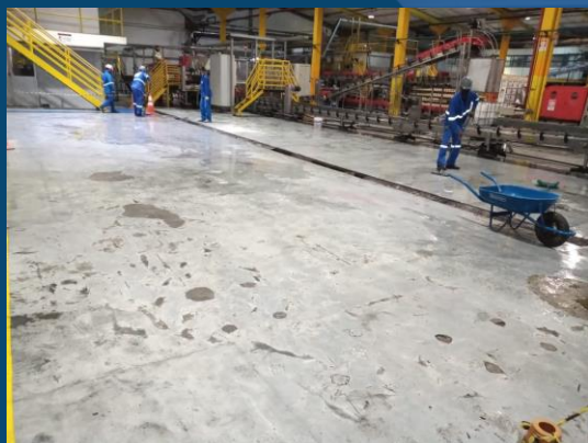
RECUPERAÇÃO DE PISO, COM AUTONIVELANTE