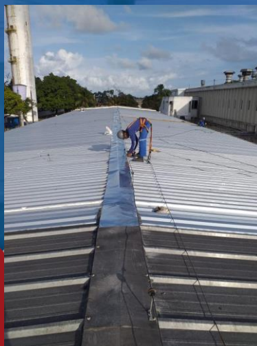
REFORMA E REPARO EM TELHADO METÁLICO