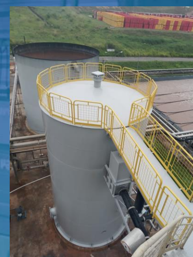
REVESTIMENTO E TRATAMENTO EM POLIURETANO (PU). EM ESTRUTURAS METÁLICAS SEGUINDOS OS PADRÕES DE SEGURANÇA