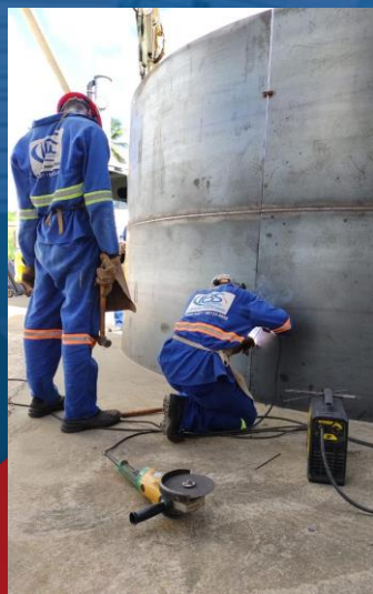
SOLDA EM TANQUE.