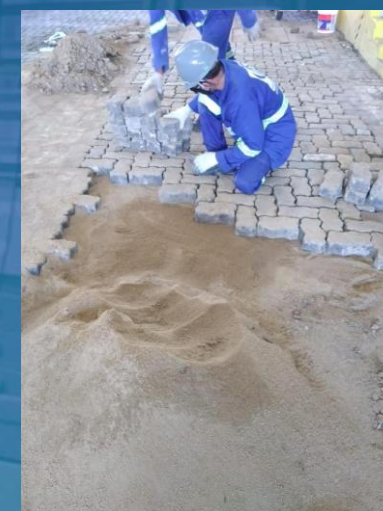
INSTALAÇÃO DE PISO INTERTRAVADO