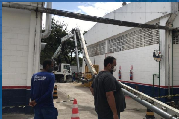
CONCRETAGEM DE LASTRO LATERAL – BASE DE CONCRETO ARMADO PARA ESTUFA