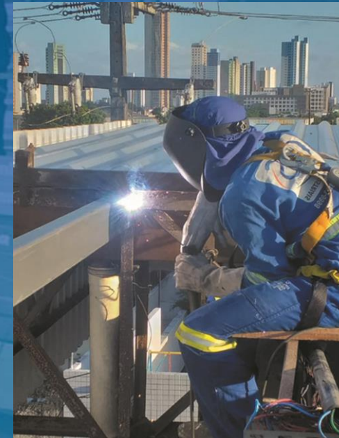
REPARO EM ESTRUTURA METÁLICA