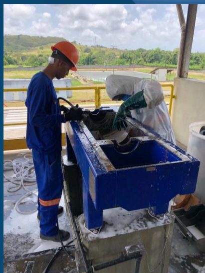
MANUTENÇÃO DE CENTRÍFUGA

✂ MONTAGEM E DESMONTAGEM DE ESTRUTURAS E EQUIPAMENTOS INDUSTRIAIS