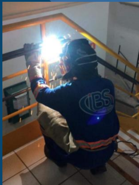
REPARO EM CORRIMÃO